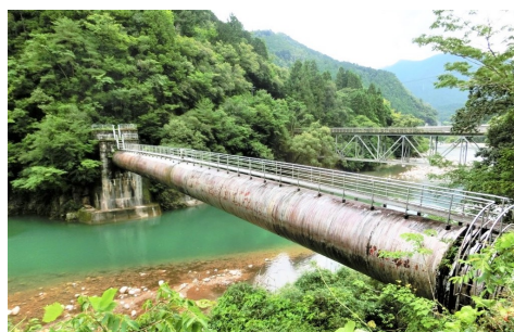
佐久間ダムから宇連川へ 大千瀬(振草)川を渡る佐久間導水路

佐久間ダムのある天竜川の水源は諏訪湖。諏訪湖にはアルプスの雪解け水も流入する。天竜川の水は、遠州灘へ流れ、三河湾には来ない地形だが、佐久間ダムから佐久間導水路を経て、宇連ダムを介さず、宇連川に放流され、東三河の農業用水に流れ込む。農繁期だけだが、宇連ダムが空になると、佐久間ダムから水がもらえる、宇連ダムを空にすれば、大島ダムや各地の調整池に関係なく佐久間ダムから水がもらえる。一方、マスコミは水不足を煽って、設楽ダム建設を擁護する。半世紀前、日本列島改造論が叫ばれ、都市の工業化が急進展、都市人口も急増により水は足りない、一方、渥美半島